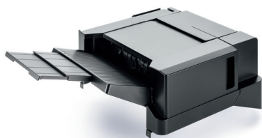
FINISHER 300 FOGLI DF-5100 Capacità in uscita fino a 300 fogli con pinzatura fino a 50 fogli in tre posizioni.