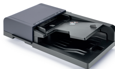
ALIMENTATORE DI ORIGINALI DP-5100 Alimentatore di originali da 75 fogli inverte automaticamente documenti stampati su due facciate.