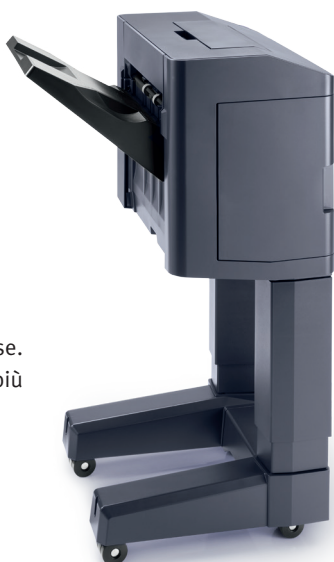
FINISHER 1.000 FOGLI DF-5110 Finisher 1.000 fogli per stampe voluminose. Pinzatura fino a 50 fogli in tre posizioni, più foratura opzionale.